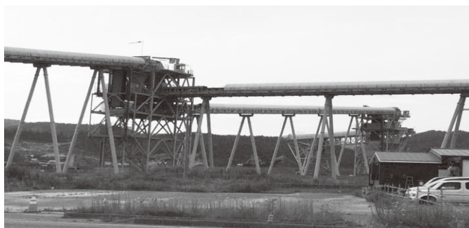
山からの土を運ぶベルトコンベアが続く

4年経った今でも川に車や木々が流れついているのを見た時、衝撃でした。私たちにできることは少ないですが、今回その数少ないボランティアに携わることができ、良い経験でした。 教育学科1年次生