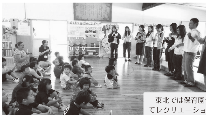
堤乳児園での交歓風景

テレビで報道がほとんど見られなくなりましたが、現地では4年も経っているのに何も変わっていません。そんな中、子どもたちの輝く笑顔を見ると心が和みます。しかし同時に、辛い気持ちにもなりました。 秘書科2年次生